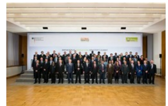
Групповой снимок по случаю завершения глобального форума продовольствия и сельского хозяйства 2014 GFFA

Политической кульминацией форума была 6-ая Берлинская встреча на высшем уровне министров сельского хозяйства во Всемирном зале в Министерстве иностранных дел, крупнейшая в мире встреча аграрных министров [APD].