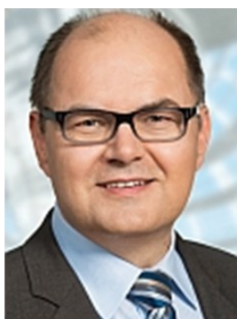
Министр продовольствия и сельского хозяйства Германии Кристиан Шмидт

Новое германское федеральное правительство под руководством федерального канцлера Ангелы Меркель приступило к своей работе в конце 2013 года.