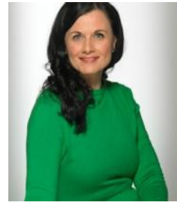
Руководитель Комитета по продовольствию и сельскому хозяйству Гитта Конеманн

тает в ХДС, с 2002 года она является депутатом Германского Бундестага [Agrarzeitung].