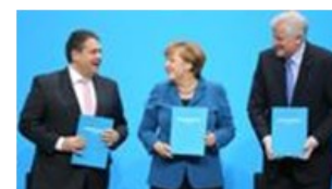
Заключение коалиционного договора

Федеральная программа по экологическому земледелию остаётся в силе. Есть стремление продолжить курс на рыночную направленность в молочном хозяйстве и мобилизовать усилия по созданию эффективной и надёжной сети безопасности в ЕС.