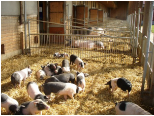
Производство био продуктов будет поддерживаться по новой программе — экологического производства свинины в южной части Германии

В Европейском Союзе существует 20 различных программ для поддержки сбыта сельскохозяйственных продуктов в третьи страны. Общий бюджет трехгодичных программ по поддержке сбыта сельскохозяйственных продуктов в государствах, не являющихся членами ЕС, составляет 60,2 млн. Евро, причем 50 % средств финансируются непосредственно ЕС. Запланированные программы включают в себя оказание поддержки при экспорте свежих и переработанных фруктов и