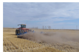
Продажи немецкой аграрной техники выросли в 2011 году

спроса в 2010/2011 году можно объяснить и наверстывающими инвестициями. Тем самым государственные инвестиционные программы не являются причиной растущих продаж сельскохозяйственной техники [АПД].