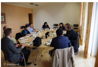
Круглый стол в кооперативном банке Тоепен, Бавария

С 9 по 15 октября пять представителей казахстанского аграрного и аграрно-финансового сектора находились в Германии в рамках учебной поездки на тему сельскохозяйственных кооперативов и кредитных товариществ. Отраслевая информационная поездка была организована АПА и профинансирована немецкой и казахстанской стороной. Командировка началась в Берлине, где группа наряду с Федеральным министерством продовольствия, сельского хозяйства и защиты прав потребителей посетила Германский союз кооперативов и Банка