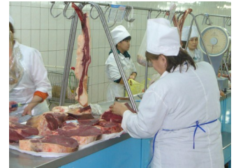
Продажа мясной продукции в продуктовом отделе торгового центра «Евразия»

Дальнейшее улучшение системы ветеринарного контроля в настоящее время имеет большое значение для Казахстана, так как в рамках программы по развитию производства говядины запланирован сбыт говядины на международные рынки. Поэтому сейчас Министерство сельского хозяйства Республики Казахстан стремится к постоянному улучшению ситуации по эпизоотии и здоровья животных в стране [АПД].