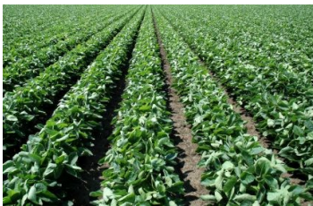
Soya bean production

Министерство сельского хозяйства Республики Казахстан поручило ТОО «Аналитический центр экономической политики в АПК» (АСЕРПАС) разработать мастер-планы по следующим культурам: кукуруза, рапс и соя. При составлении мастер-планов по первым двум культурам АПД оказал поддержку Аналитическому центру при анализе данных и составлении рекомендаций по возделыванию данных культур. Аналитический центр получил содействие от АПД в сфере возделывания сои.