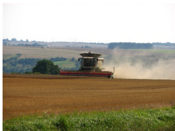
Уборка зерновых в Восточной Германии

С начала хозяйственного года 2011/12 до конца ноября Европейский Союз экспортировал в общей сложности 7,85 млн. тонн зерна. Это на 3,3 млн. тонн меньше, чем за аналогичный период прошлого года. В целом потребность в товарном зерне в хозяйственном 2011/2012 году внутри Европейского Союза оценивается в 331,4 млн. тонн, из которых 280,2 млн. тонн из внутреннего производства, а 37,2 млн. тонн должны быть